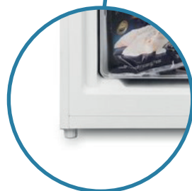
Výškově stavitelné nožky