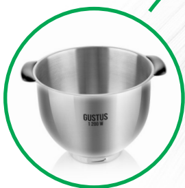
Nerezová mísa 5,5 l