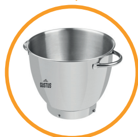
Nerezová mísa o objemu 5,5 l